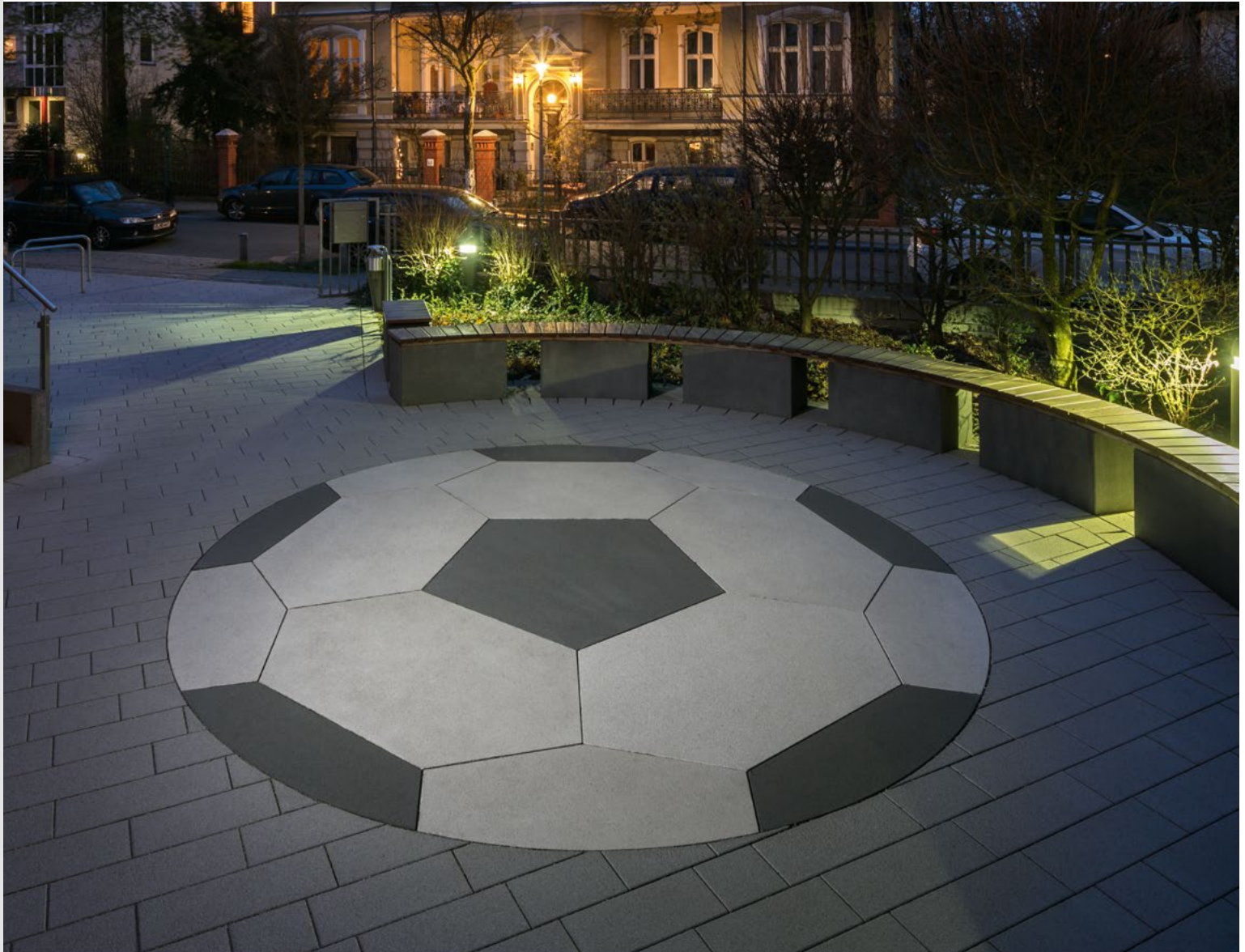
Motiv Fussball; Vorplatz mit Licht in Szene gesetzt