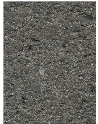
Abbildung: terralit Rutschhemmung R 13 für Pflaster Stärke 7,8 cm Mit geschliffener und feingestrahlter Naturstein- Oberfläche