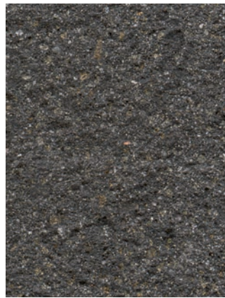
Abbildung: rinnit Platin schwarz Rutschhemmung R 13 Mit stahlsandgestrahlter Naturstein-Oberfläche