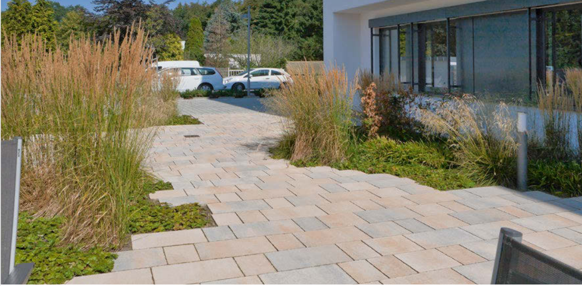
Objekt: Bürotterasse, Bad Lippspringe Produkt: Fiero Platten Format: 20 - 50 x 28 x 6,5 cm Farbe: color Jura-Beige