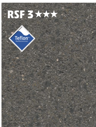
Abbildung: terralit Nero Rutschhemmung R 12 Mit geschliffener und feingestrahelter Naturstein- Oberfläche Mit Imprägnierung RSF 3 mit Teflon™ Oberflächenschutz