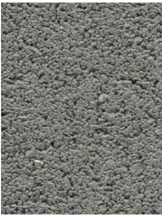
Abbildung: Standard Grau Rutschhemmung R 13 Hartgestein-Edelsplitt-Oberfläche