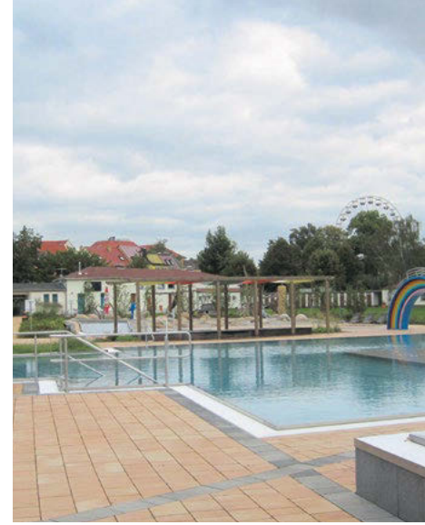
Objekt: Parthebad, Taucha Produkt: Fiero Platten Format: 20 - 50 x 28 x 6,5 cm Farbe: color Cotto