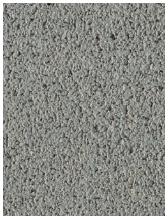
Abbildung: color Canyon Grau hell Rutschhemmung R 13 Mit eingefärbter Hartgestein- Edelsplitt-Oberfläche