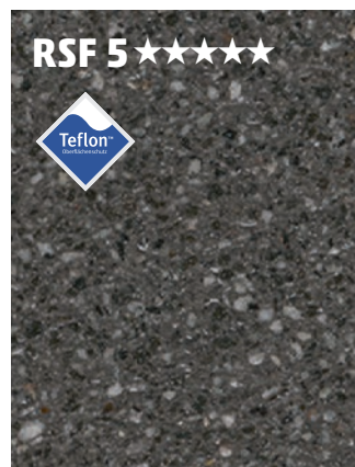
Abbildung: terralit Luna terralit RSF 5 wahlweise Rutsch- hemmung R 11 oder R 12 Mit geschliffener und feingestrahelter Naturstein- Oberfläche

Mit Beschichtung RSF 5 mit Teflon™ Oberflächenschutz