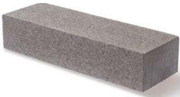
Abdeckstein 5 60 x 20 x 12,5 cm