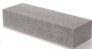
Kombistein 2 60 x 20 x 12,5 cm