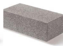
Kombistein 3 40 x 20 x 12,5 cm