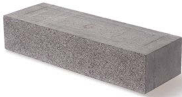
Scona Mauer rinnit Basalt