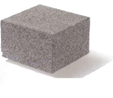
Kombistein 4 20 x 20 x 12,5 cm