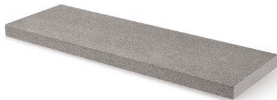
Mauerabdeckung 12 100 x 30 x 6 cm