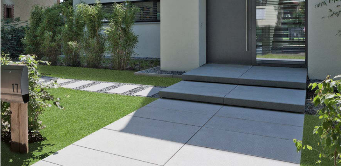
Format: 120 x 60 x 8 cm Farbe: rinnit Platin mittel