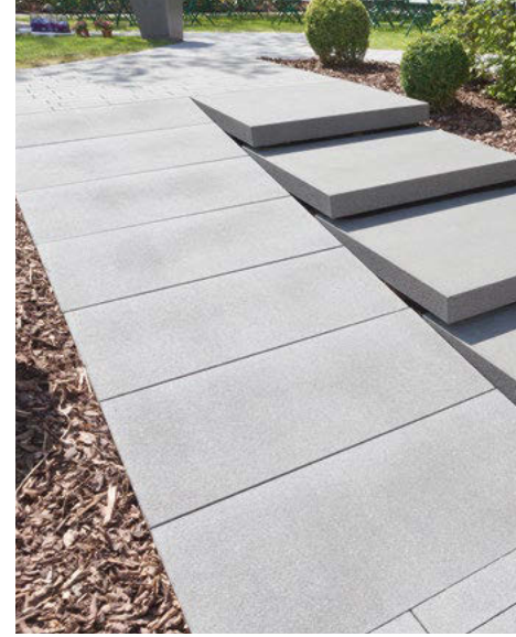
Format: 120 x 60 x 8 cm Farbe: rinnit Platin mittel Kombiniert mit Signo Stufenplatten