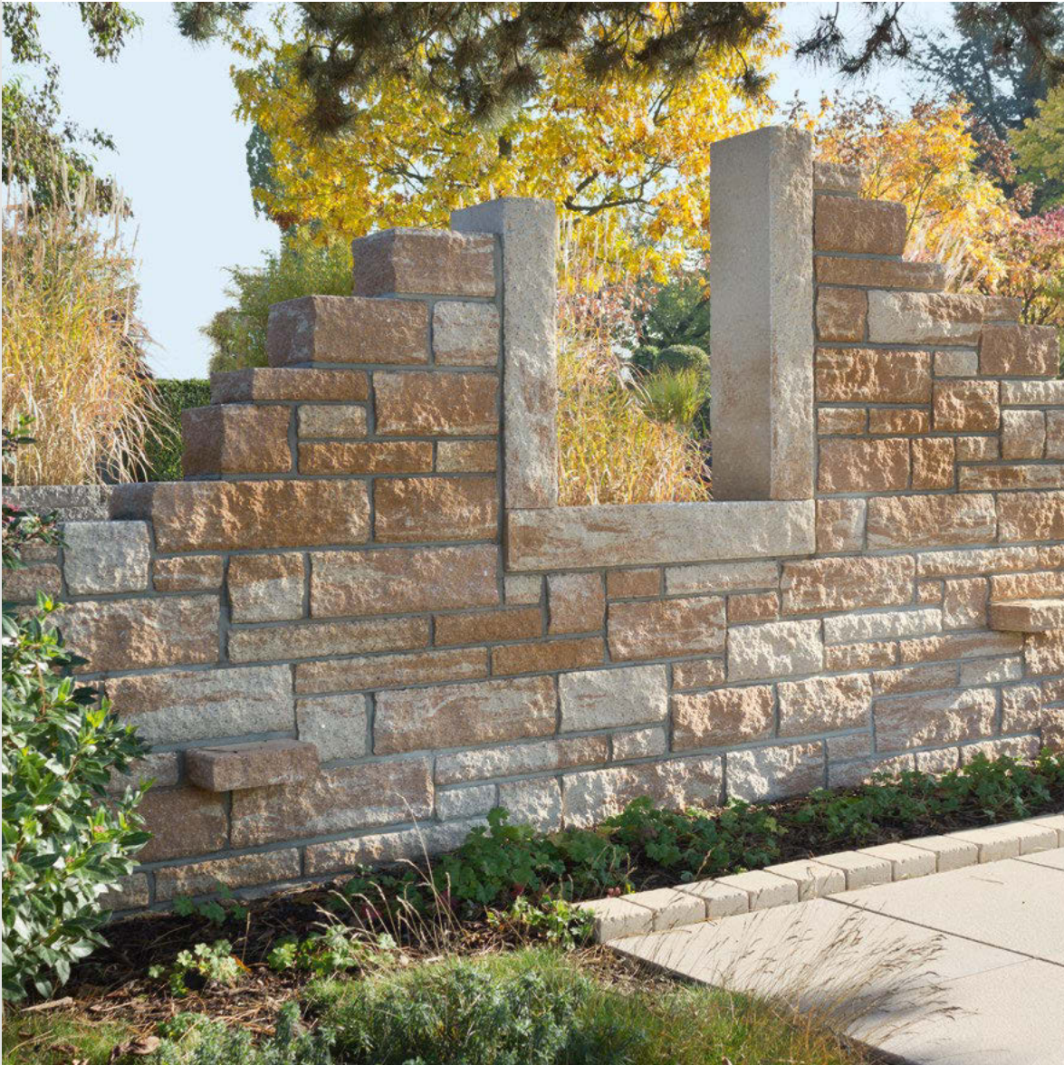
Produkt: Toskana Mauer Format: 7,5 cm und 15 cm Steinhöhe Farbe: rustica Beige-Braun