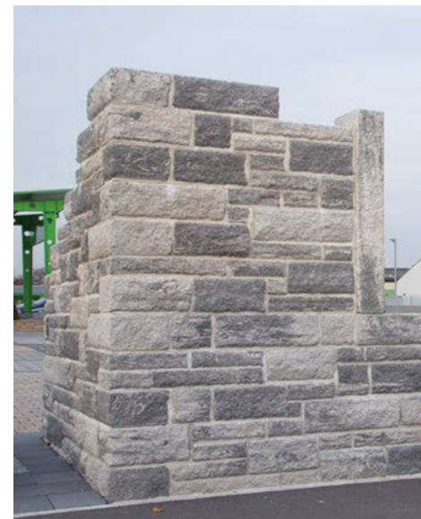
Produkt: Toskana Mauer Format: 7,5 cm und 15 cm Steinhöhe Farbe: rustica Grau-Anthrazit