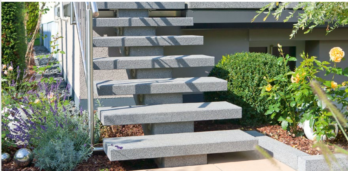
Produkt: Sonderlösung Einbalkentreppe Format: bis 120 x 35 x 20 cm Farbe: rinnit Granit