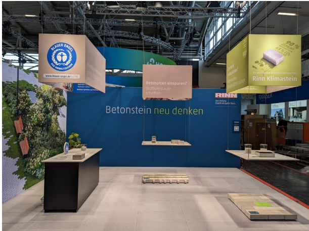
Bildunterschrift: Rinn Messestand auf der Messe BAU, Halle A2, Stand 300